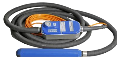
RUNNER65 – 75