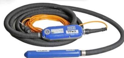
RUNNER38 – 58