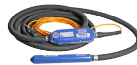
RUNNER38 – 58